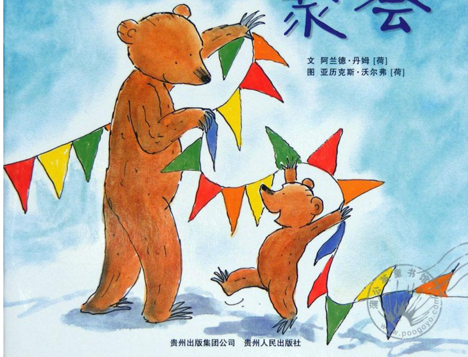
图 亚历克斯·沃尔弗 [荷]