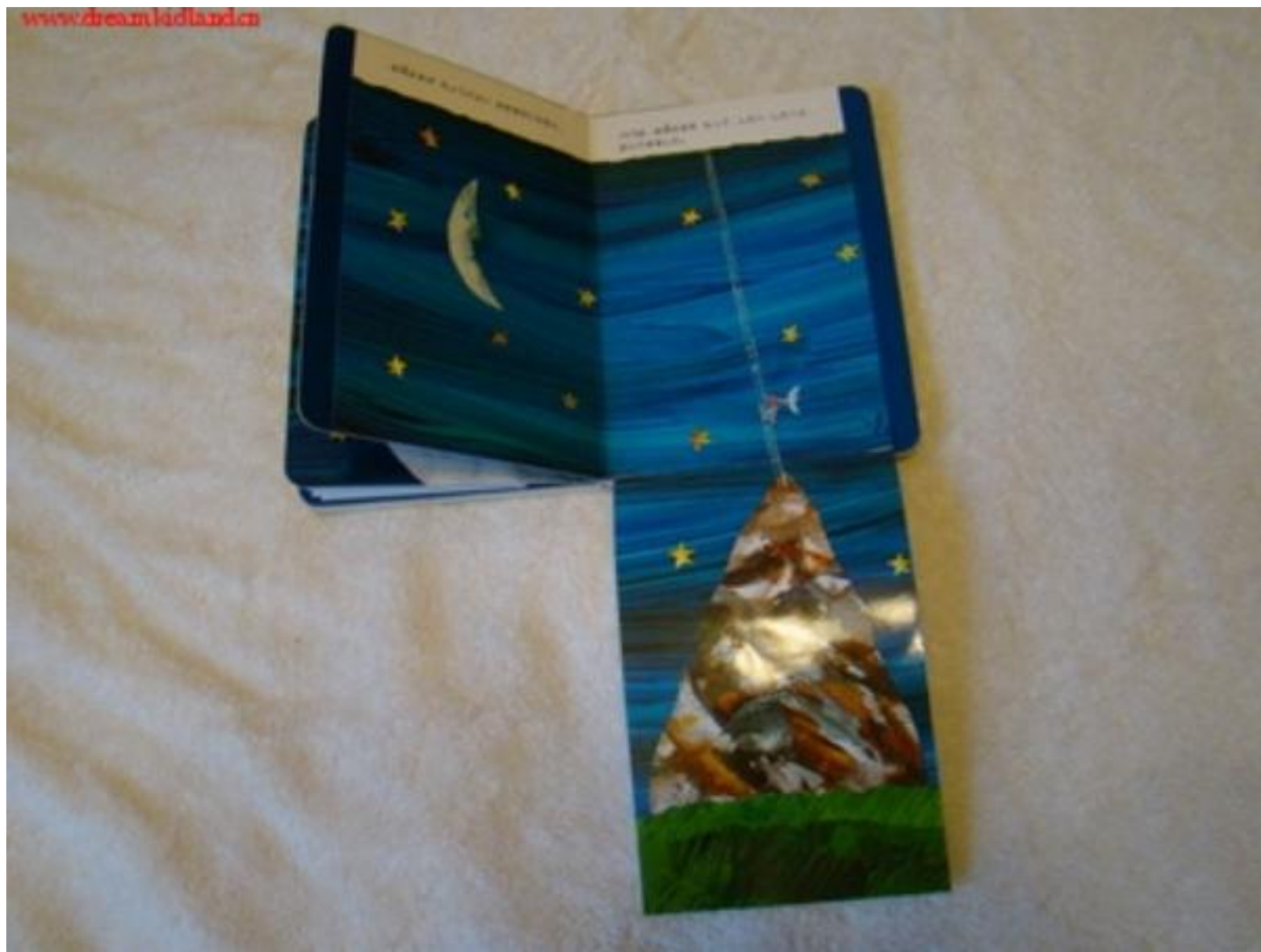
爸爸摘到月亮，拿在手中，一点点从梯子上面爬了下来。