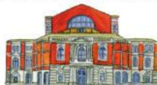
拜罗伊特节日剧院

科隆大剧院位于阿根廷的首都布宜诺斯艾利斯，于1908年5月启用，是全球知名的歌剧院，可容纳3 000多名观众。几乎所有伟大的歌剧演员，例如：维内·巴托里、恩里科·卡鲁索、玛丽亚·卡拉丝、普拉西多·多明戈、普拉西多·帕瓦罗蒂等，都曾在这里演出。