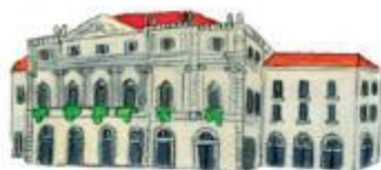
维也纳国家歌剧院

1778年启用的米兰斯卡拉歌剧院，与威尼斯的凤凰剧院同属世界知名的歌剧院。这当然与歌剧源于意大利有关，而这两座歌剧院也见证了歌剧的演变和发展。许多歌剧的首演都是在斯卡拉歌剧院或凤凰剧院举行的。