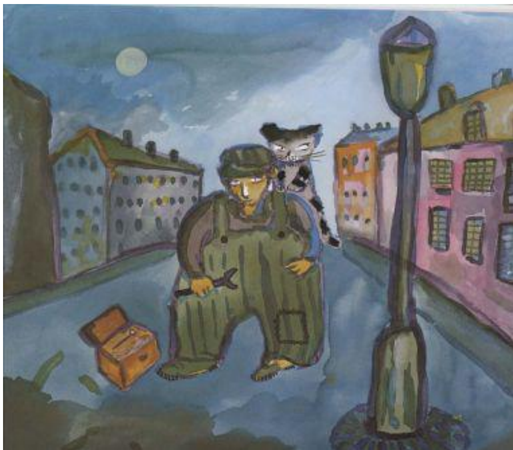
曾经是一个小偷的猫