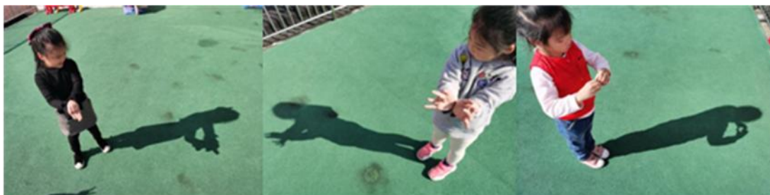
图3-3-2 游戏“阳光下的手影”

活动结束后，教师在区域中投放了很多关于“光影”的游戏材料，在阳光明媚的日子，会和幼儿们一起玩玩影子游戏，引导幼儿观察影子和身体造型的联系（图 3-3-2）。有的幼儿会用身体变出小动物，有些幼儿在阳光下舞动起来，一边跳舞一边观察着影子的变化，乐此不疲。