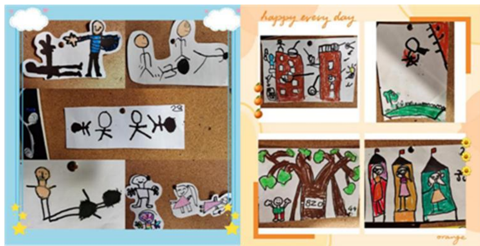
图3-1-1 我想了解的生活中的秘密

谈话了解了幼儿想知道的秘密，并请他们通过绘画和前书写的方式进行记录（见图1）。从幼儿的讨论和记录中发现，原来大家对生活中的放大镜、影子、数字、轮子和手机等事物和现象产生了强烈的好奇