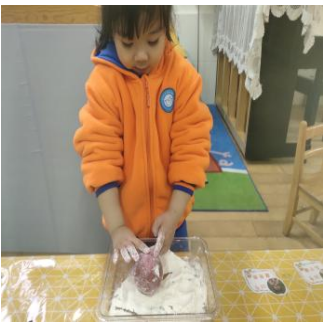
图1-3-5 将苹果与面粉混合在一起