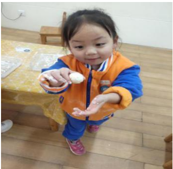
图1-3-3 揉出了成型的面团