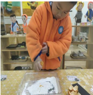
图1-3-4 将桔子水滴在面粉上