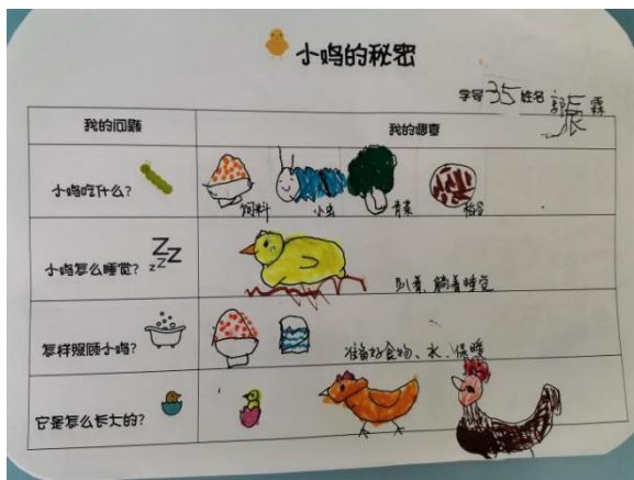
图 4 调查表：小鸡的秘密

5 月 10 日，周一。孩子们将自己的调查结果（图 4）和收集的物资带来了幼儿园。他们调查发现：小鸡喜欢吃米、菜叶、鸡饲料等食物；小鸡需要喝水、洗澡、睡觉。于是，孩子们大包小包给小鸡带来了食物，带了喂水喂食的小杯子、小盆子，还带了枕头与被子想让小鸡睡得更舒服。还有个孩子买了两只小鸡在家观察照顾小鸡需要做哪些准备，最后也将小鸡带到了幼儿园。为此，孩子们成立了照顾小鸡的小分队，每个孩子都承担了照顾小鸡的任务。