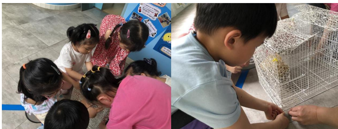
图7 找到合适的材料改造鸡笼

说干就干，孩子们拿着材料和鸡笼比对，努力将材料裁出适合鸡笼大小的尺寸，还把之前用过的大大小小的扭扭棒当做扣子，将材料扣在鸡笼上（图7）。孩子们虽然是第一次做这件事情，但是他们合作、用心地给小鸡装饰新家。最后小鸡们的家焕然一新，小鸡飞不出去了。